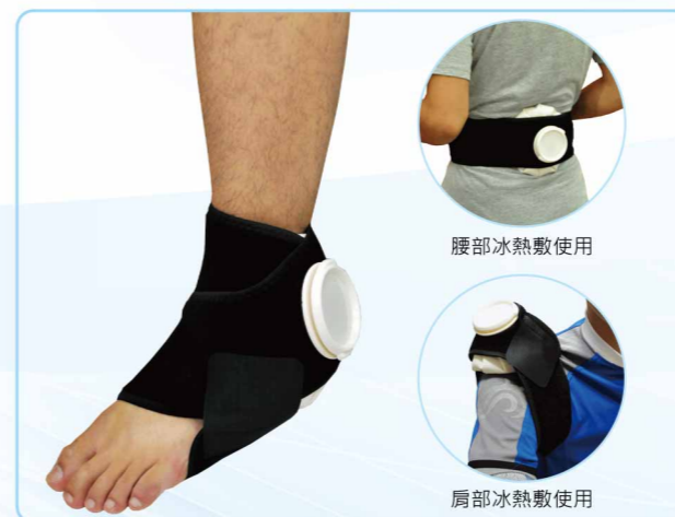
04029 冰熱敷包簡易固定帶 Hot & Cold Simple Support ■ / S·M·L