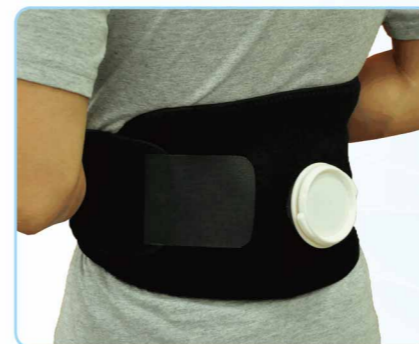
04032 冰熱敷護腰 Hot & Cold Waist Supporter ■ / FREE