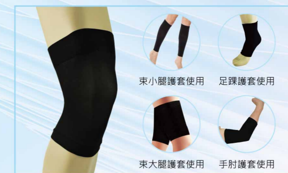
04114 鈦離子多功能護套 Titanium Multifunctional Care Sleeves 居家睡眠時的良伴 ■ / FREE