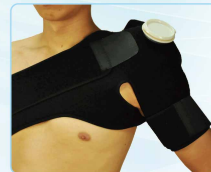
04030 冰熱敷護肩 Hot & Cold Shoulder Supporter ■ / FREE