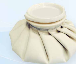
04034 冰熱敷袋 Hot & Cold Bag ■ / FREE