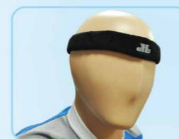
04200 抗菌排汗頭帶 Anti-bacteria & Wicking Headband 黑/白 / FREE