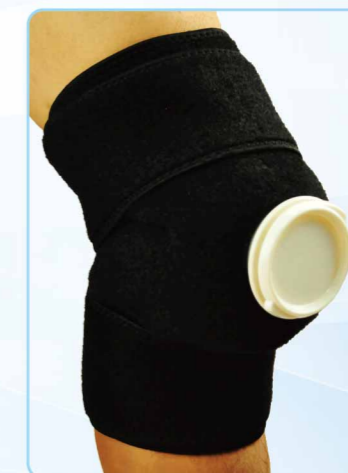
04031 冰熱敷護膝 Hot & Cold Knee Supporter ■ / FREE