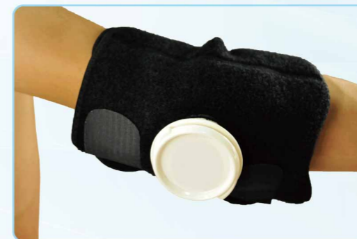
04033 冰熱敷護肘 Hot & Cold Elbow Supporter ■ / FREE