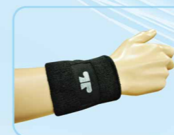
04201 抗菌排汗護腕 Anti-bacteria & Wrist Supporter 黑/白 / FREE